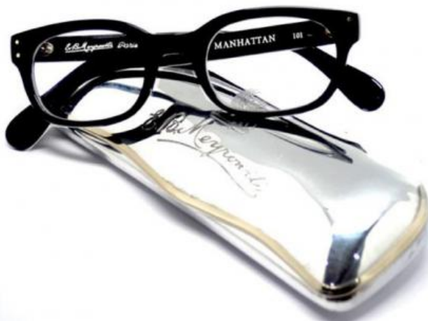
Lunettes Manhattan

Le lunetier, proche de la place Vendôme, fête ses 140 ans cette année. Une excellente raison d'aller découvrir les créations mythiques revisitées de cette belle maison, au Salon de l'Homme, du 26 au 29 novembre. On en profitera pour s'offrir une paire de Goggles tout droit venues des années 20, parfaites en moto ou en cabriolet.