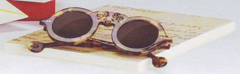
Chapeau Virginie MAISON MICHEL Le Questionnaire de Proust ASSOULINE Lunettes de soleil PY E. B. MEYROWITZ