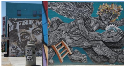
Downtown Las Vegas, bohème et vintage