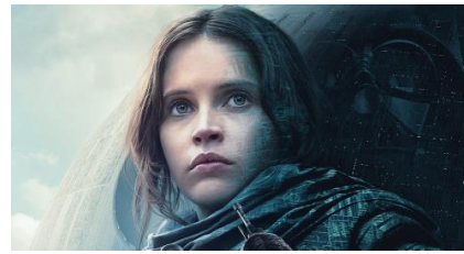
Rogue One : A Star wars story se dévoile