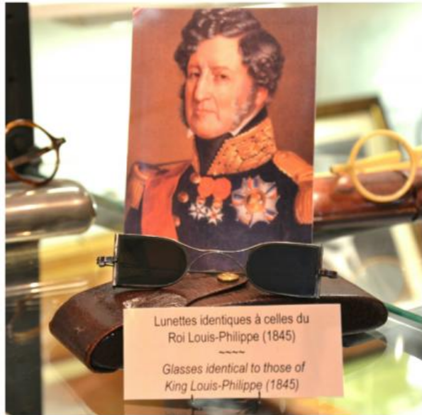
Des lunettes VIP