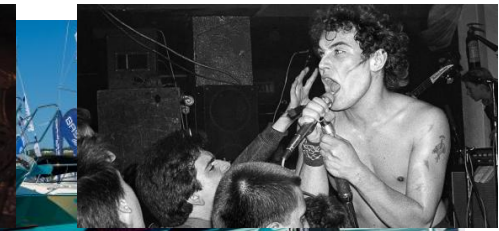
Les punks s'affichent chez Paul Smith