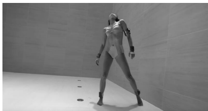
De Clara Luciani à James Blake, la plavlist de la semaine