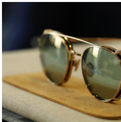
Meyrowitz x Bentley : les lunettes