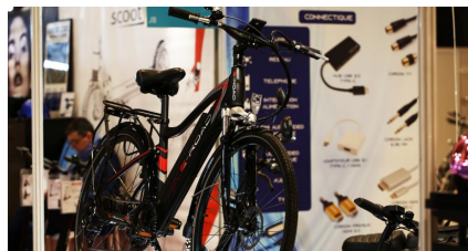
E-Road : nos 2 coups de coeur vélo électrique et COCO Beach