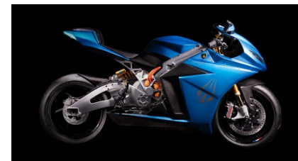
Lightning Strike : la moto sportive électrique en 3 points