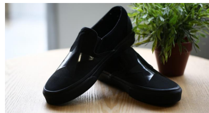
Vans David Bowie Classic Slip- On : nos photos de l'édition