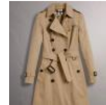
LE TRENCH BURBERRY, LA CHAÎNE ET CHANEL, DES T...