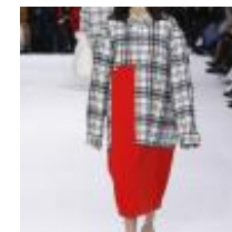
LA ROBE ARCHITECTURÉE ROU...