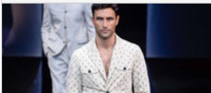
Giorgio Armani - Menswear - Milan