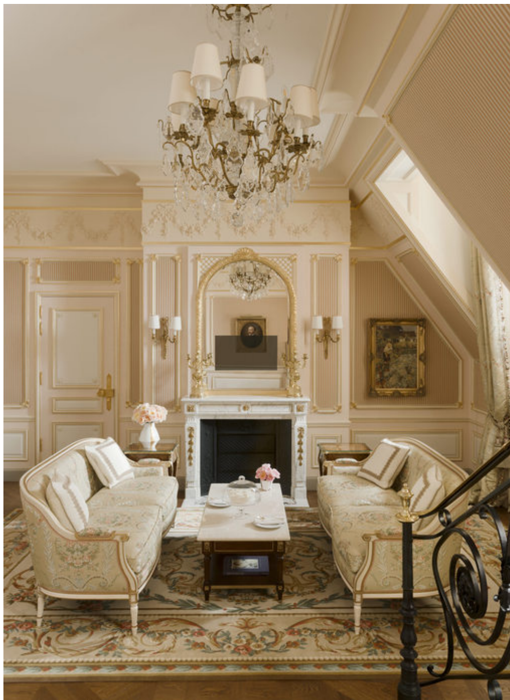
Suite César - Vincent Leroux

Toutes les photos : Milan - Menswear Printemps/Été - 2017