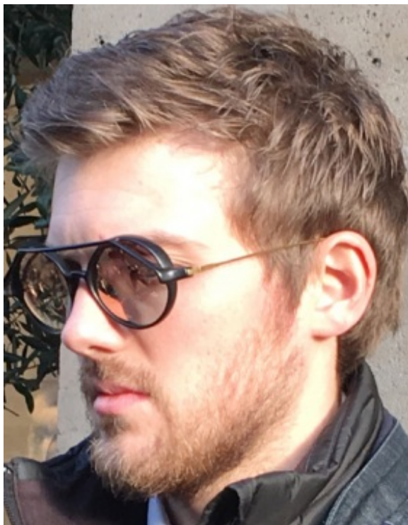
Impressio allie style et technique

évoquer des lignes contemporaines. La nouveauté : partir sur des dessins plus qualitatif avec des volumes et des angles qu'on ne peut pas réaliser d'emblée en acétate », explique à acuite.fr Jean-Manuel Finot, directeur général de la Maison Meyrowitz à Paris, qui a obtenu l'exclusivité de cette collection pendant 2 mois.