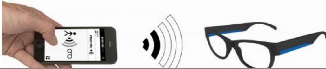
Des lunettes reliées à votre smartphone