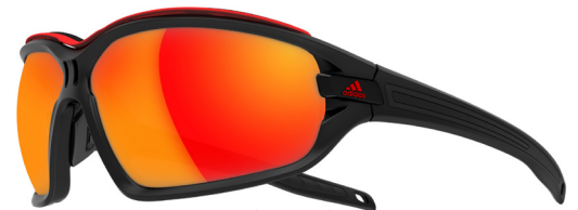
Lunettes pour le vélo