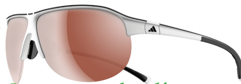
Lunettes pour le golf