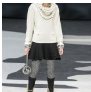
Chanel : tant de beauté au Grand Palais