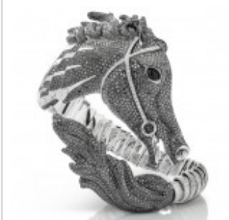
Roberto Coin sort son bracelet Arabian Horse