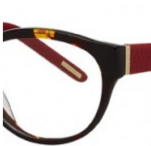
Nina Ricci Eyewear : rétro et coloré