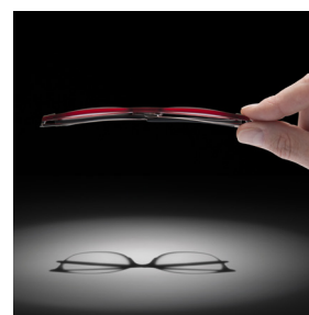
Lunettes iHuman métalliques ou en plastique (légèreté et résistance extrême)

Chez Meyrowitz, le choix de verres étant très large, on peut y intégrer par exemple, des verres à teinte variable pour plus de confort à l'extérieur. Ou encore des verres polarisés (pour la conduite).