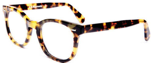
BROADWAY COLLECTION «VINTAGE SPIRIT»

C'est le «come back» des montures de caractère, en imitation d'écaïlle, avec une relative épaisseur.