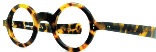
SACHA COLLECTION «VINTAGE SPIRIT»