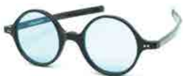
R2 Claude Monet

La R2 (branches droites), avec plusieurs couleurs de verre, comme le bleu turquoise de Claude Monet dont les verres de lunettes ont été conservés.