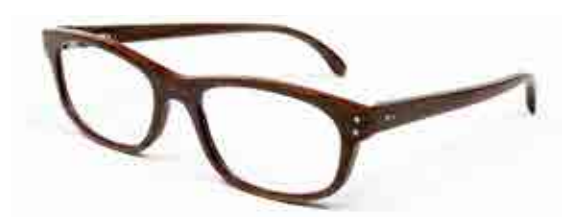
SLACK EN BOIS DE BUBINGA

La SLACK prend son envol en 2010 avec la corne de buffle noire, à la finition dépolie, satinée. En 2012, elle est créée en bois, avec différentes essences, ébène, ébène de Macassar et Bubinga.